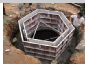
4. Assemblare lo stampo del collo del digestore