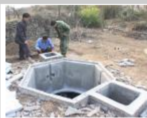
7. Costruire le vasche di ingresso e di uscita