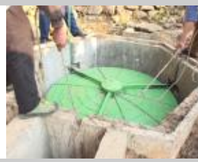
8. Collocare la campana sul collo del digestore