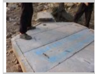
9. Coprire il collo del digestore