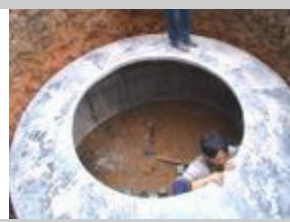
2. Assemblare lo stampo del digestore primario