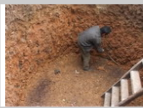
1. Preparare l'alloggio