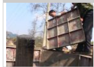
6. Smantellare lo stampo