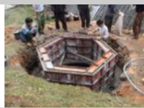
5. Versare la colata del collo del digestore