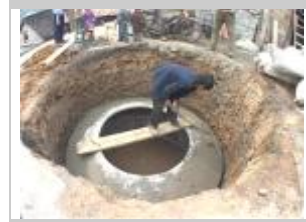
3. Preparare il digestore primario